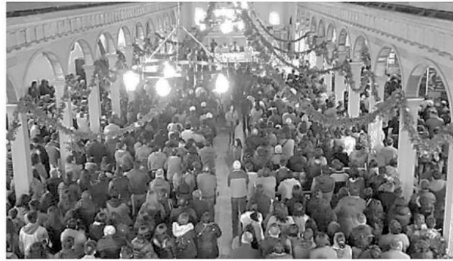
LA IGLESIA NUESTRA SEÑORA DE GRACIA DE QUINCHAO ES LA MAYOR DEL ARCHIPIÉLAGO.